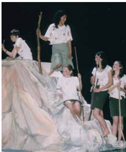
« Terre Perdue »