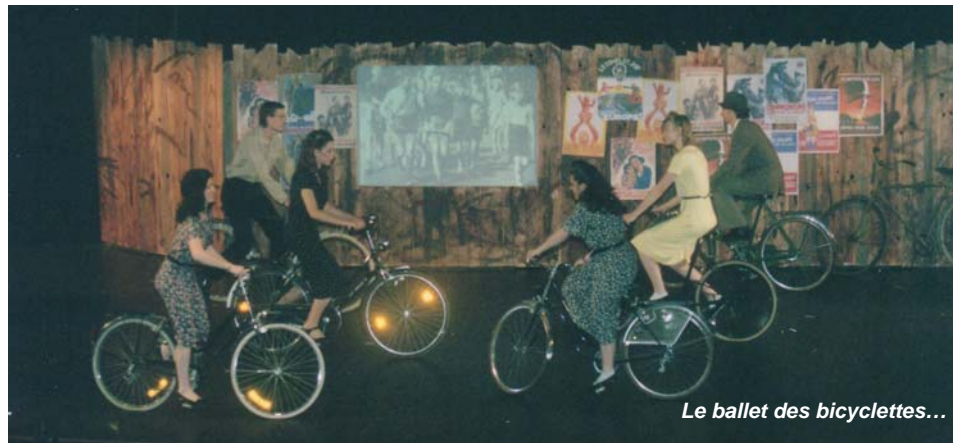
Le ballet des bicyclettes...

Réservations obligatoires à la Mairie de Vert-St-Denis : 01.64.10.59.02